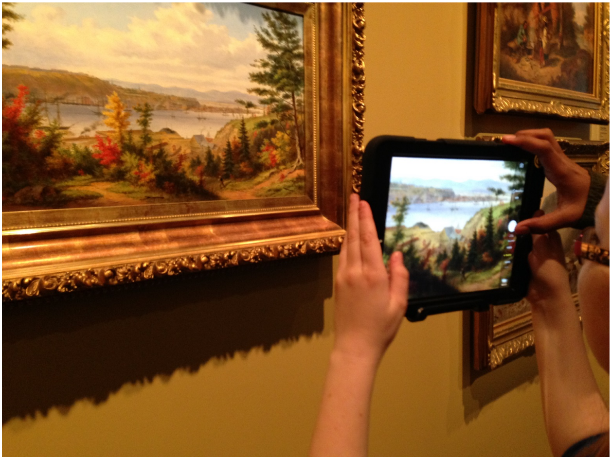
Figure 4. Prise de vue à l'aide du iPad, Musée des beaux-arts de Montréal

Rappelons que le scénario pédagogique invitait les élèves, en équipe de deux, à documenter une œuvre en particulier, qui leur était assignée, et à décrire le parcours de l'artiste. Au moyen d'iMovie, ils devaient réaliser un reportage sur cette œuvre lors d'une visite en salle d'exposition et d'un atelier de création vidéo (voir les figures 4 et 5). Pour la réalisation des vidéos, les élèves ont reçu les consignes suivantes : présenter en une minute une œuvre et indiquer ce qu'on peut apprendre sur l'occupation du territoire par la société québécoise vers 1900, puis la jumeler à une autre œuvre exposée qui peut s'y apparenter, soit parce qu'elle est du même artiste, soit par la similarité de son sujet ou de la technique employée. Au terme de l'atelier, les élèves étaient invités à diffuser leur vidéo sur le site Vimeo de manière à pouvoir y accéder après la visite.