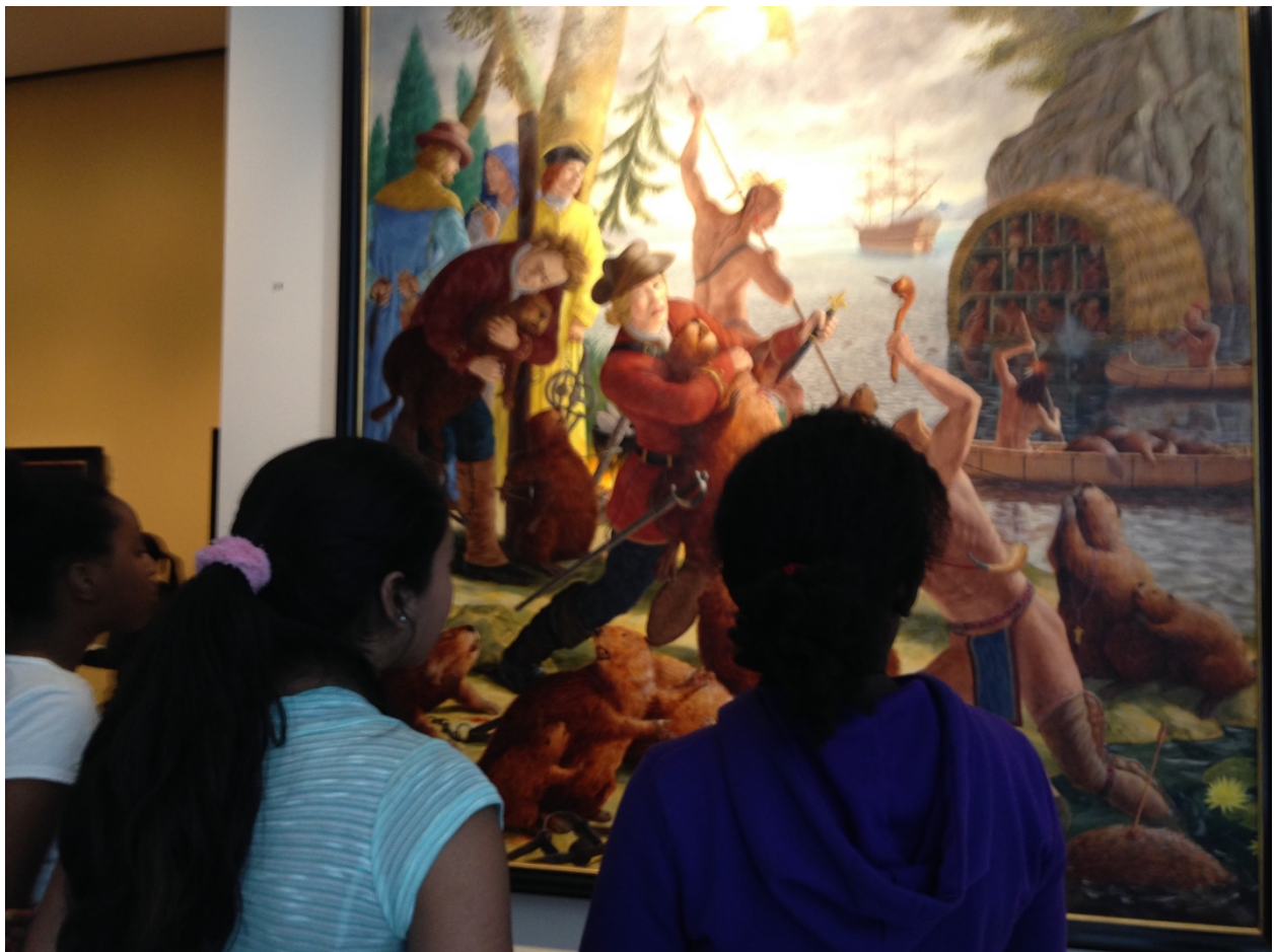
Figure 6. Élèves observant l'œuvre « Les castors du roi » de Kent Monkman (2011), exposée dans le Pavillon Bourgie du Musée des beaux-arts de Montréal

caractère stimulant des activités pour les élèves, leur appropriation rapide de l'iPad comme outil d'exploration de l'exposition et des œuvres, de création d'un reportage, et leur engouement pour la découverte spontanée de plusieurs œuvres, non ciblées par le projet, jalonnant leur parcours à l'exposition. Sollicitant la curiosité des élèves, l'une d'elles a déclenché un questionnement manifeste (voir la figure 6). Intitulée « Les castors du roi » du Canadien Kent Monkman (2011), cette œuvre de très grand format utilise les codes réalistes de la peinture d'histoire pour représenter le massacre subi par les castors au temps de la traite des fourrures en Nouvelle-France, alors que tous adoptent, dans une allégorie religieuse, la foi catholique. Incidemment, les élèves ont fait part de leur désir d'avoir plus de temps pour visiter l'exposition et pour créer une vidéo.