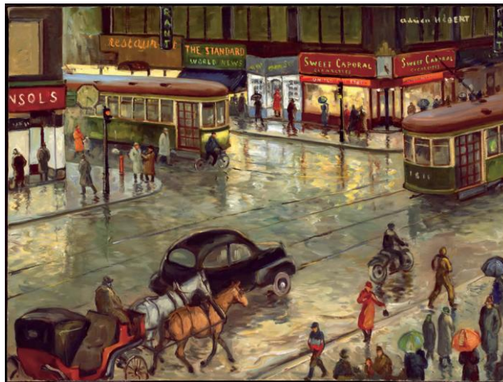
Figure 1. Hébert, Adrien Angle Peel et Sainte-Catherine , vers 1948 (Musée des beaux-arts de Montréal, 2010.645)

Pour la conception du dispositif muséo-techno-didactique, nous avons établi des liens entre la collection du MBAM et le PFÉQ et dégagé un thème commun, celui de la société québécoise vers 1900, nous intéressant aux transitions que vit le Québec qui s'urbanise rapidement à cette époque. Ainsi, nous avons constitué un corpus de 12 paysages et scènes de genre réalisés des années 1840 aux années 1940, exposés dans le nouveau Pavillon Bourgie, par douze artistes du Québec et du Canada qui, pour la plupart, de retour d'un séjour de formation en Europe, s'intéressent au caractère singulier des paysages d'ici (voir un exemple à la figure 1).