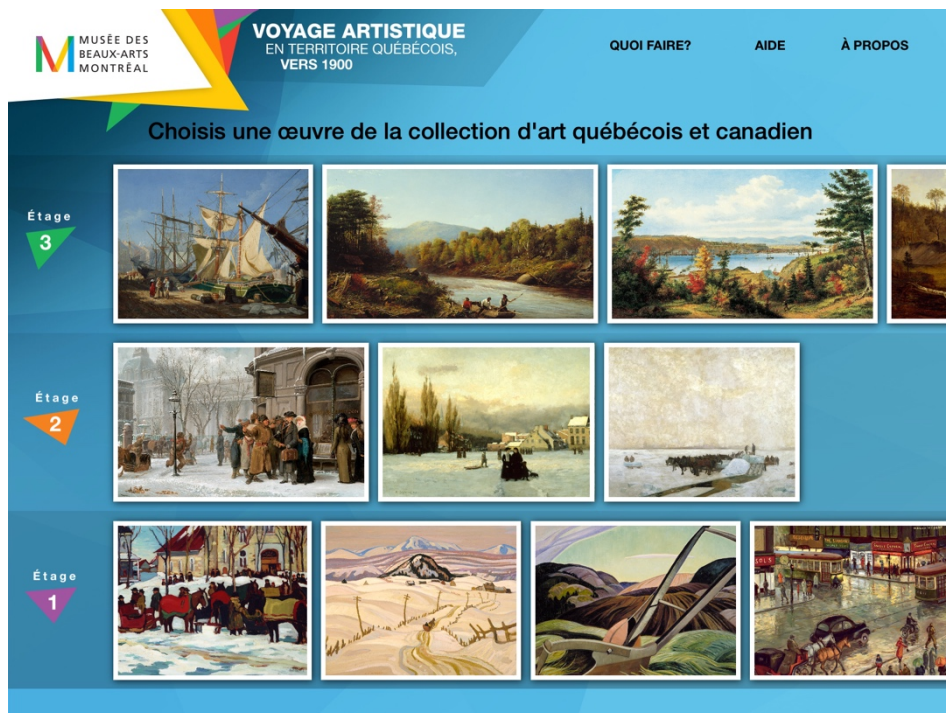
Figure 2. Page d'accueil du prototype de l'application pour iPad « Voyage artistique en territoire québécois, vers 1900 »

fonctions : 1) outil d'exploration de l'exposition permanente du Pavillon Bourgie et 2) outil de découverte des œuvres ciblées. Il est couplé à un dispositif de puces placées derrière les douze œuvres ciblées sur trois des cinq étages de l'exposition permanente, émettant un signal Bluetooth au visiteur qui s'en approche lorsqu'une œuvre peut être explorée au moyen du prototype. Ce message contient une question incitant à observer l'œuvre. Le prototype comprend également un court texte présentant la pensée de l'artiste sur son œuvre, de même qu'un portrait ainsi qu'une brève biographie de cet artiste, une carte ancienne, datant de l'époque de l'œuvre et situant le lieu représenté, ainsi qu'un jeu d'observation « Trouvez les erreurs » (à partir d'une reproduction truquée de l'œuvre à comparer avec celle exposée en salle) (voir les figures 2 et 3). Hormis certains portraits d'artistes, l'application présente des contenus originaux et complémentaires à l'exposition en ligne du MBAM présentant la collection d'art québécois et canadien.