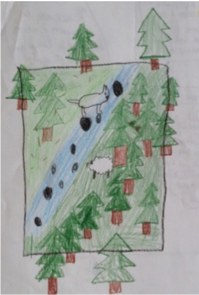
Illustration 4 : Dernier dessin fait par le même élève lors de la septième séance