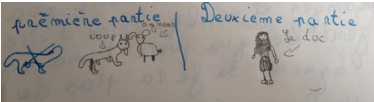
Illustration 5 : Dessin réalisé par Lomane lors de la première séance