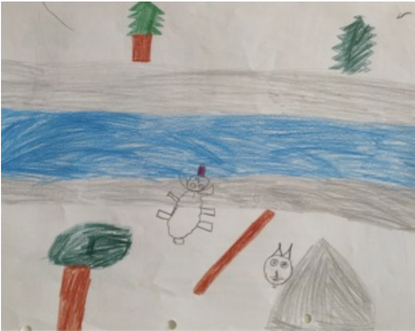
Illustration 6 : Dessin réalisé par la même élève lors de la dernière séance

Une synthèse mettant en valeur l'évolution des dessins permet d'obtenir le tableau 6.